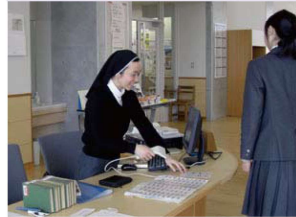
Phục vụ : Tại Thư Viện