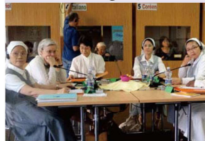
Tổng Tu Nghị