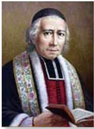
Cha Chaminade (1761~1850)

Cha Chaminade là người có đức tin mạnh mẽ vào Thiên Chúa. Ngài rất sùng kính Mẹ Maria và luôn phó thác tất cả mọi sự cho Mẹ. Và là người đã sống hết mình cho sứ vụ Giáo Dục Đức Tin cho mọi người.