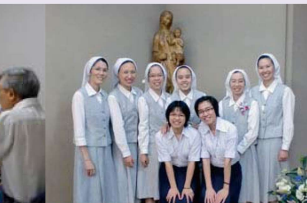
Các Sơ Việt Nam