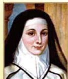
Mẹ Adele (10/6/1789~10/1/1828)