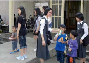
Tại Giáo Xứ