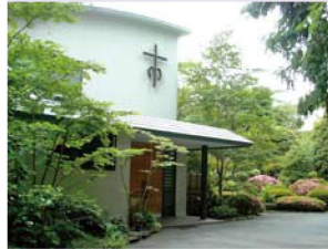
Cộng đoàn Chofu (Trụ Sở Chính)