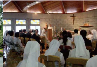
Bắt đầu một ngày mới bằng Cầu Nguyện