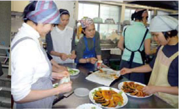
Tại Nhà Tình Tâm