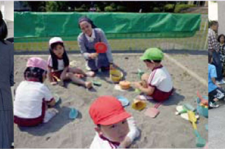
Tại Mầm non