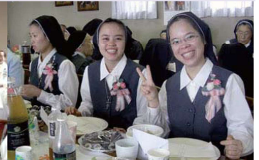
Niềm vui Thánh Hiến