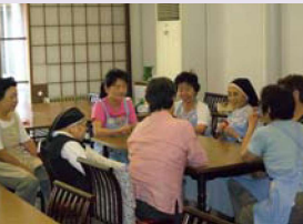
지역 주민들과의 교류