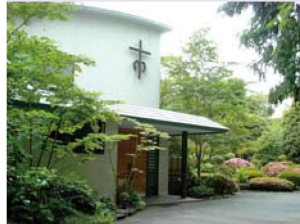
초후 수도원 현관