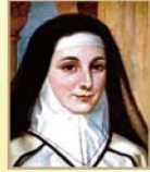
모: 아델드바르트 랑켈레옹 (1789/6/10~1828/1/10)