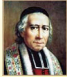
부: 조셉 사미나드 (1761/4/8~1850/1/22)