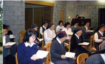
하루의 시작은 기도로부터