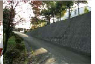
기도의 길(마찌다 피정의 집)