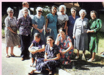
ヨーロッパのアリアンス・マリアルのメンバー