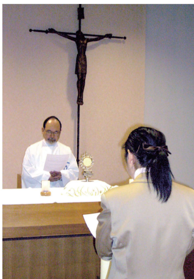
修練院への受入式