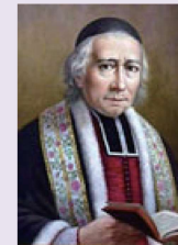
シャミナード神父