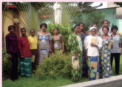
アフリカのアリアンス・マリアルのメンバー